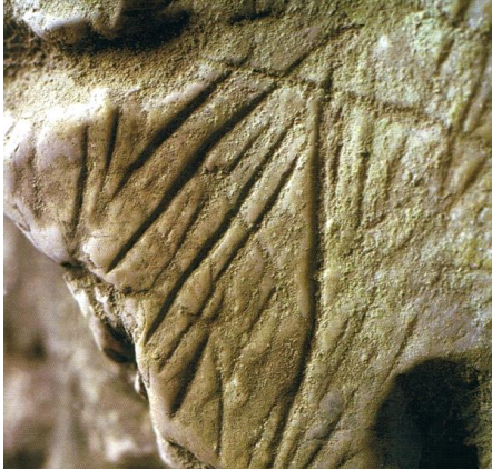
Autor Fotografía:Arte rupestre prehistórico en el oriente de Asturias-00/2007