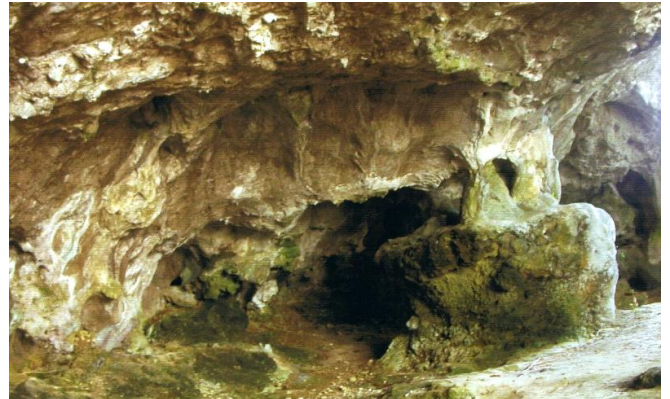
Autor Fotografía:Arte rupestre prehistórico en el oriente de Asturias-00/2007