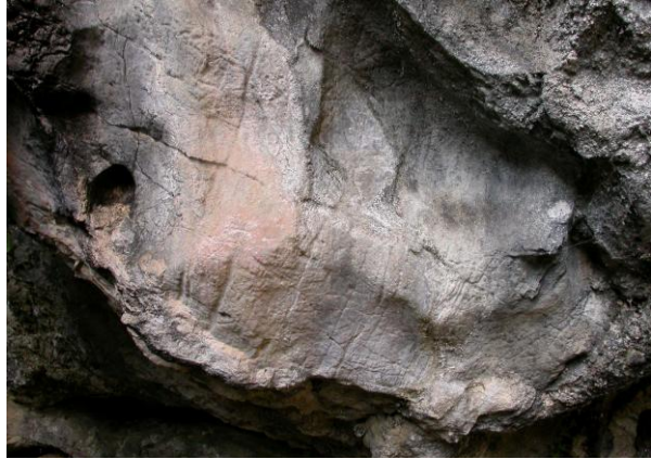
Autor Fotografía:Arte rupestre prehistórico en el oriente de Asturias-00/2007