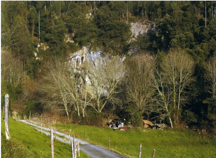
Autor Fotografía:Arte rupestre prehistórico en el oriente de Asturias-00/2007