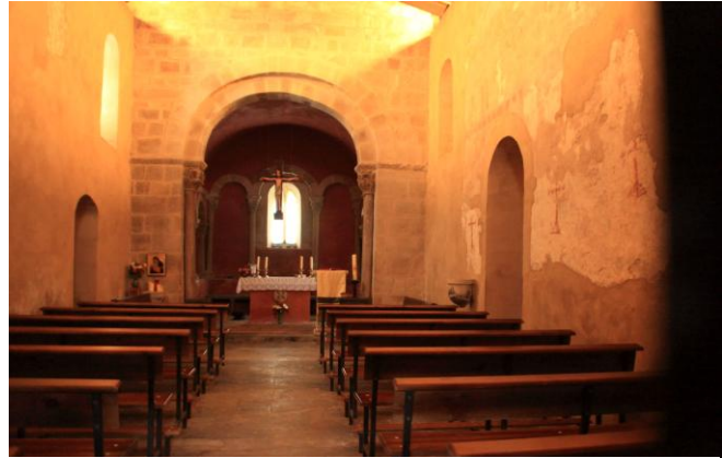
Autor Fotografía: Víctor M. Fernández Salinas-05/2011