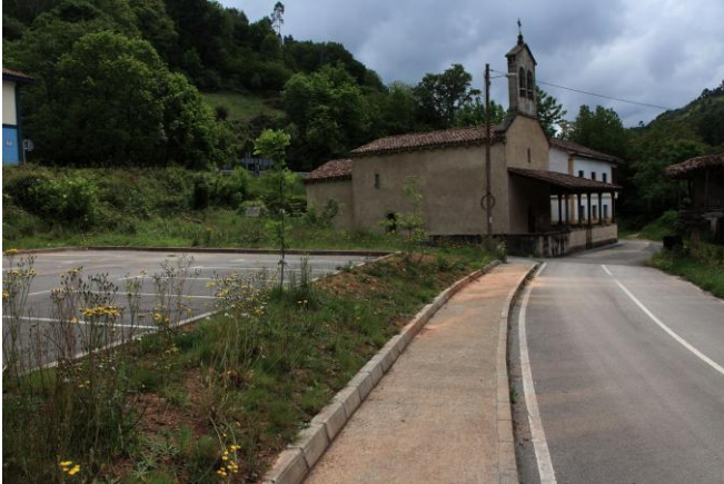
Autor Fotografía: Víctor M. Fernández Salinas-05/2011