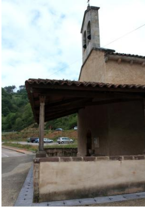
Autor Fotografía: Víctor M. Fernández Salinas-05/2011