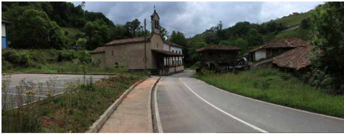
Autor Fotografía: Víctor M. Fernández Salinas-05/2011