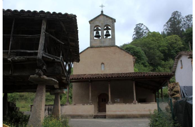
Autor Fotografía: Víctor M. Fernández Salinas-05/2011