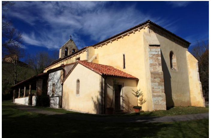
Autor Fotografía: Víctor M. Fernández Salinas-02/2011