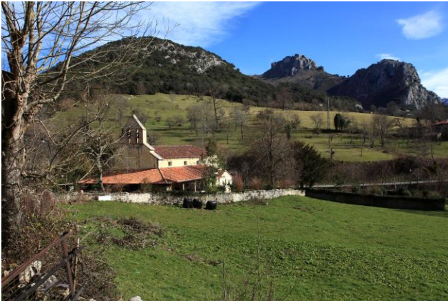
Autor Fotografía: Víctor M. Fernández Salinas-02/2011