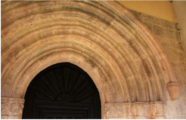
Autor Fotografía: Víctor M. Fernández Salinas-02/2011