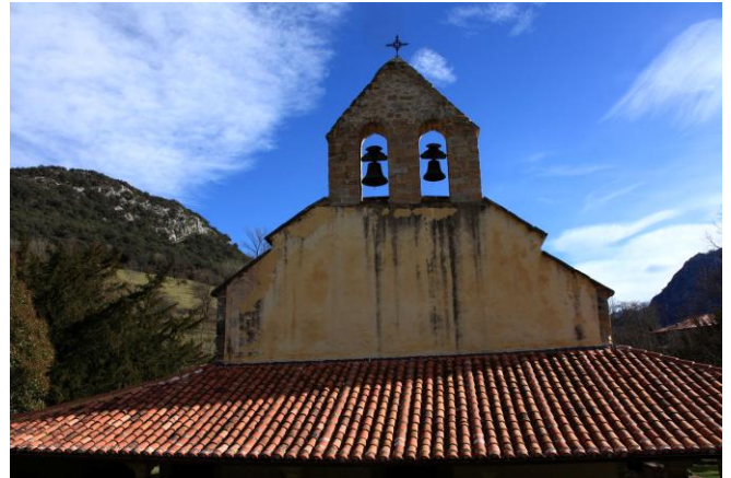
Autor Fotografía: Víctor M. Fernández Salinas-02/2011