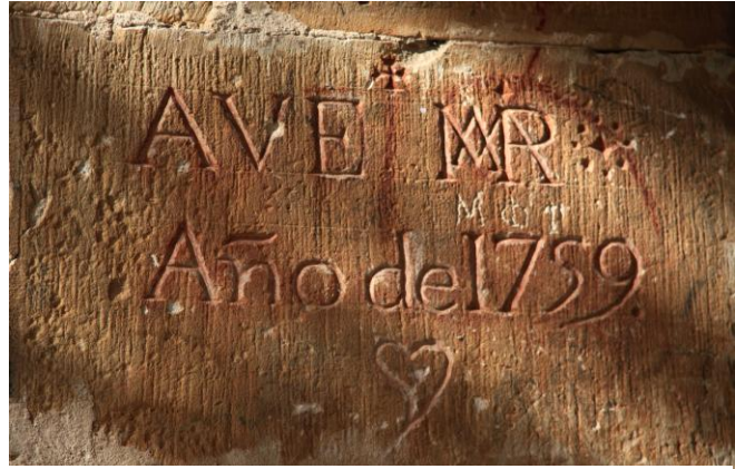
Autor Fotografía: Víctor M. Fernández Salinas-02/2011